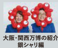
大阪・関西万博の紹介 銀シャリ編